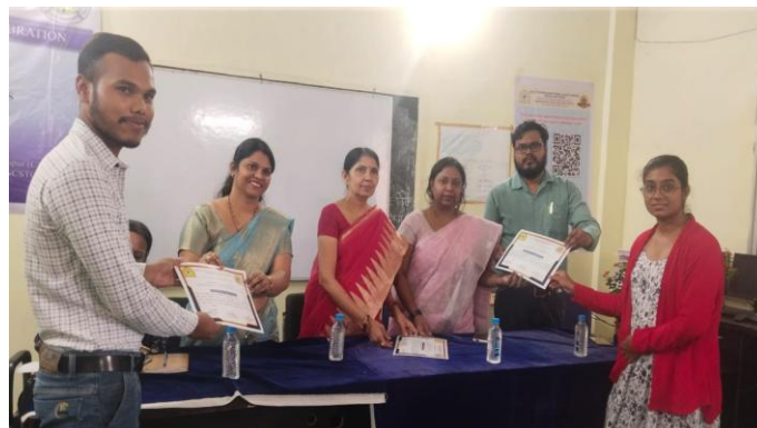
Prize and certificate distribution to students